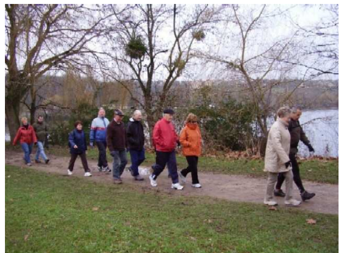
Promenade autour des lacs le dimanche 23 janvier