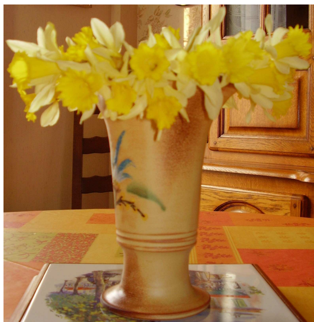
Mars, le temps des jonquilles